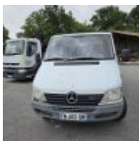
Lot n° 130