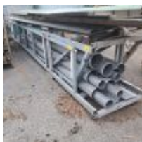
Lot n° 133