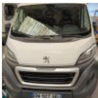
Lot n° 131