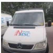
Lot n° 132