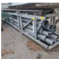
Lot n° 134